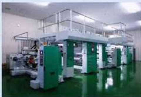
(左から) 水性フレキソ印刷機、ノンソルベントラミネーター