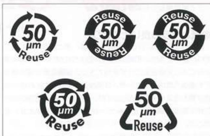
厚み 50 \mu\text{m} 以上・繰り返し使用の推奨を示す 2 次利用マーク

※レジ袋有料化に伴い、厚み 50 \mu\text{m} 以上の袋は有料化の対象外となり、袋ごとに「厚みが 50 \mu\text{m} 以上あり繰り返し使用を推奨する」旨、表示が義務付けられている(表記がないものは、厚み 50 \mu\text{m} 以上であっても無料配布が不可)