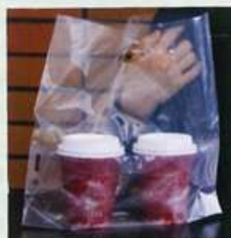
国内外で特許取得済みのキャッチバッグ

同社ではバルピースのような素材の開発だけでなく、形状の開発も手掛けており、その1つが「キャッチバッグ」（国内外で特許取得済み）。ポリ袋とカップホルダーが一体になっており、従来品の「保管に場所を要する」「台紙を入れるのに手間がかかる」「台紙が不安定で飲み物がこぼれる」といったこれらの課題を、一体化させることで解決したオリジナル商品だ。