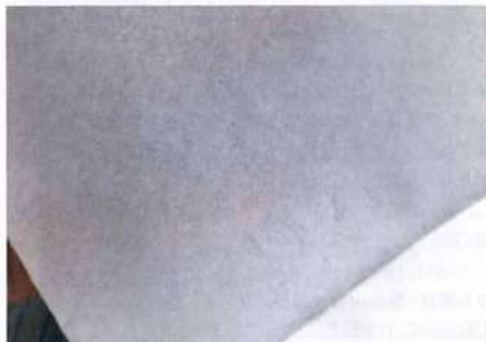
和紙のような質感と耐水性を備えた PULPEACE。グラビアや水性フレキソ、オンデマンド印刷に対応している

「木材や草などから抽出した繊維」を意味する「パルプ（pulp）」と、「安らぎ」を意味する「ピース（peace）」を組み合わせで名付けられた「PULPEACE」は、紙を粉砕し粉末化した紙パウダーを配合したパッケージ材料。汎用プラに「紙」を配合し、インフレ成膜機で製造したフィルムは包装資材では「業界初」（同社）とのこと。さらに、サトウキビ由来のバイオマスプラスチックを配合したタイプも揃え