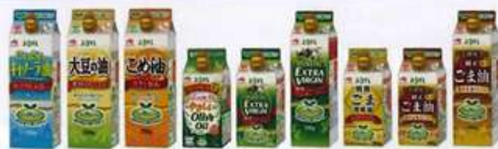
「スマートグリーンパック」。紙パック包材は凸版印刷の「EP-PAK GL」を採用

「スマートグリーンパック」シリーズの液だれ防止機能キャップ。ダブルキャップ式のため、揚げ物など大量に使う場合は大口、フライパンに薄く油をひく場合は細口と使い分けられる