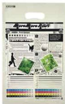
オンデマンド印刷